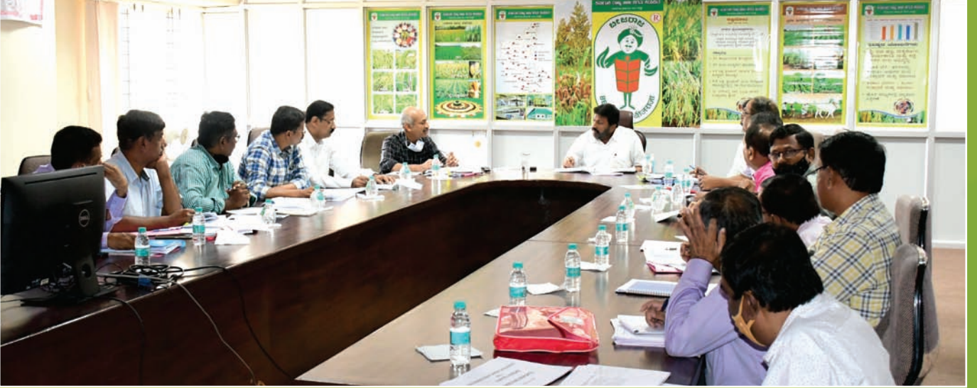
23.11.2021ರಂದು ಮಾನ್ಯ ಕೃಷಿ ಸಚಿವರು ಹಾಗೂ ಅಧ್ಯಕ್ಷರು, ಕರ್ನಾಟಕ ರಾಜ್ಯ ಖಜಾನೆ ನಿಗಮ ನಿಯಮಿತ ಇವರಿಂದ ನಿಗಮದ ಪ್ರಗತಿ ಪರಿಶೀಲನೆ