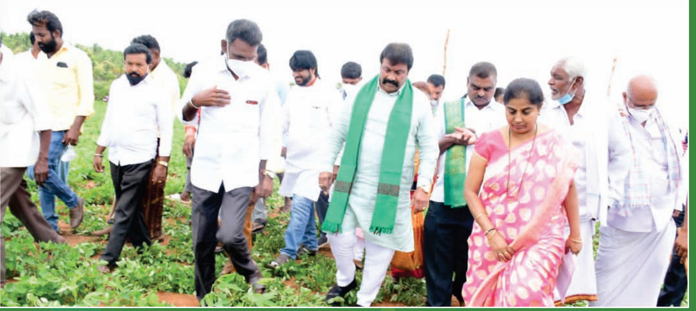
ಮಾನ್ಯ ಕೃಷಿ ಸಚಿವರಿಂದ ಕೃಷಿ ಬೆಳೆಗಳ ತಾಕಿನ ವಿಲಕ್ಷಣೆ